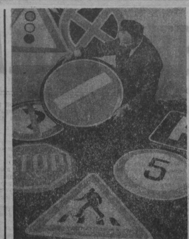
Латвийская ССР. Производственное объединение «Спитикс» ЦК ДОСААФ республики по заказу ГАИ страны изготавливает объемные дорожные знаки с внутренним освещением. Они установлены на улицах и площадях Ленинграда, Киева, Тбилиси, Риги. Объемные дорожные знаки с маркой этого предприятия сделаны из синтетического материала, не поддаются коррозии. НА СНИМКЕ: объемные дорожные знаки. Фотохроника ТАСС.