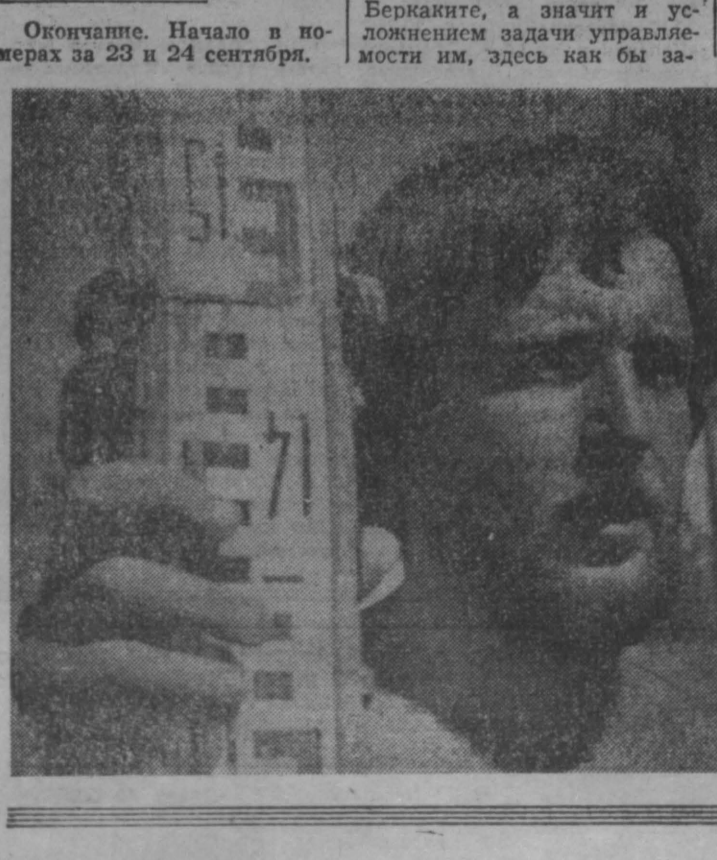
Окончание. Начало в номерах за 23 и 24 сентября.