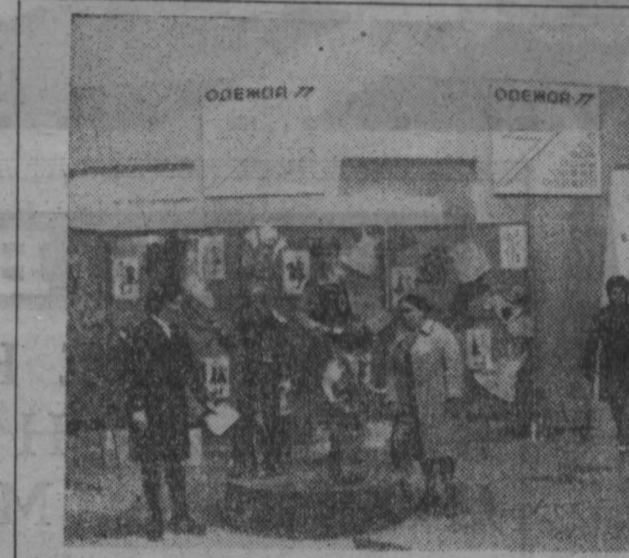
Товары для народа