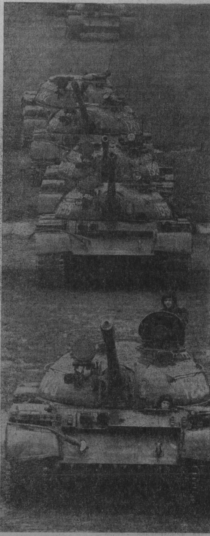
НА СНИМКЕ: подразделение танкистов Н-ской части готовится к совершенно маршу.

Д. ДЕЛЮШЕНКО, генерал-армии, дважды Герой Советского Союза. (ТАСС).