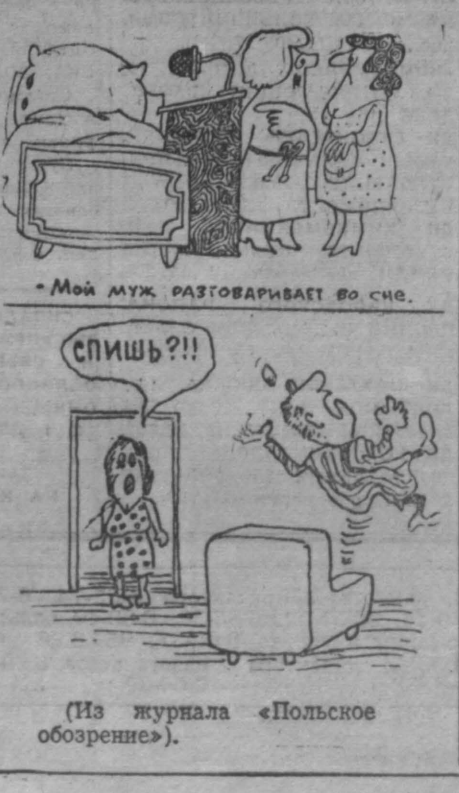
Мой муж разговаривает во сне.