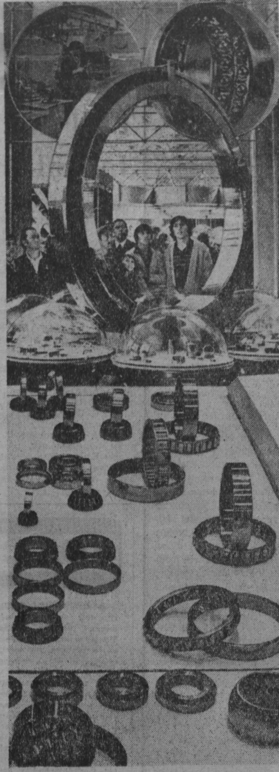
МОСКВА. Тематическая выставка «Подшипниковая промышленность — народному хозяйству» открылась во ВДНХ.