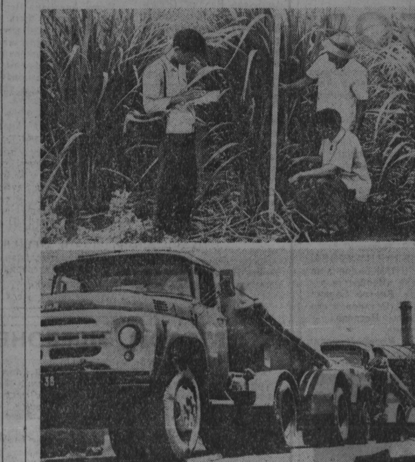
Хороший урожай сахарного тростника выращен в Центральном Вьетнаме. Там, где еще недавно шли бой и гремели взрывы бомб...

БУДАПЕШТ. В Венгерской Народной Республике началась работа Международной научной конференции по микробиологии.