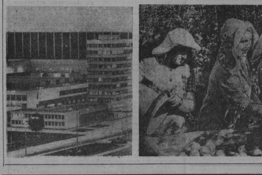
Агропромышленный комплекс в селе Паревце. Плодородный округ объявлен одним из победителей соревнования конкурса за высший и качественный урожай «Золотой плод-76».