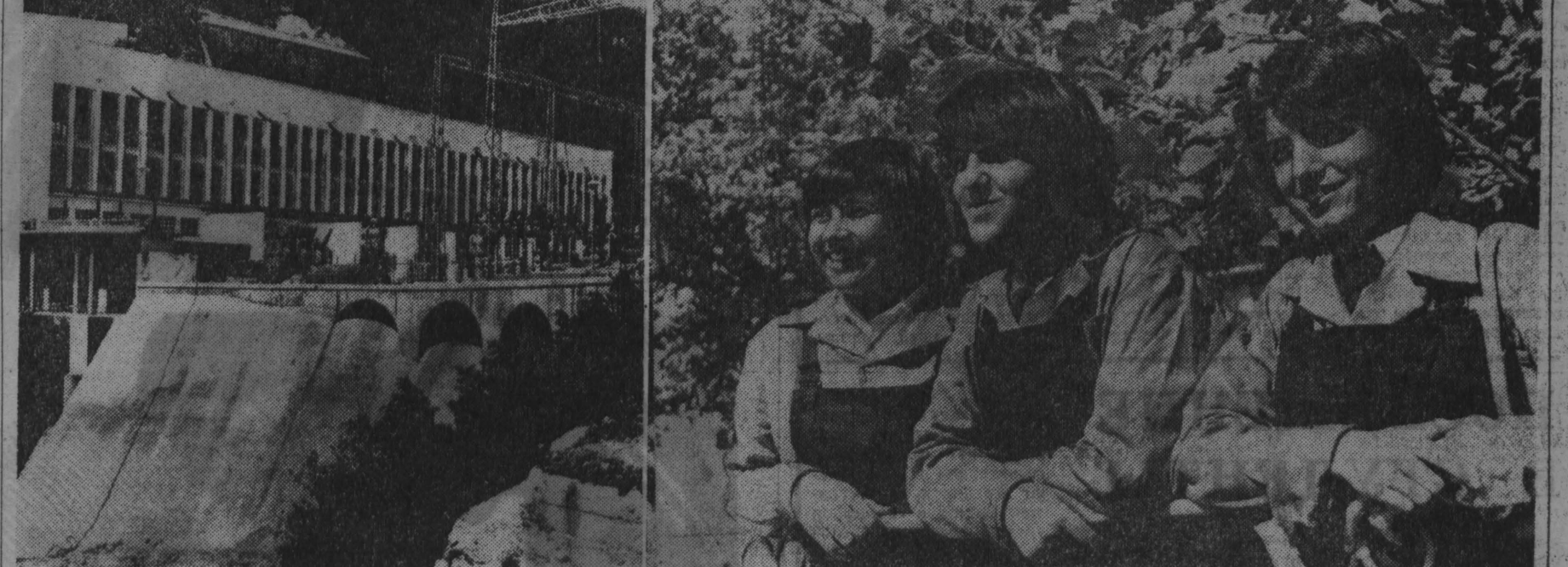
Электростанция «Белмекен» (левый снимок) — крупнейшая на Балканском полуострове. Успехи в развитии энергетической базы Болгарии стали возможны благодаря плодотворному сотрудничеству с социалистическими странами и в первую очередь с Советским Союзом.

Д. КОЛЕВ, болгарский журналист. (София-пресс — АПН).