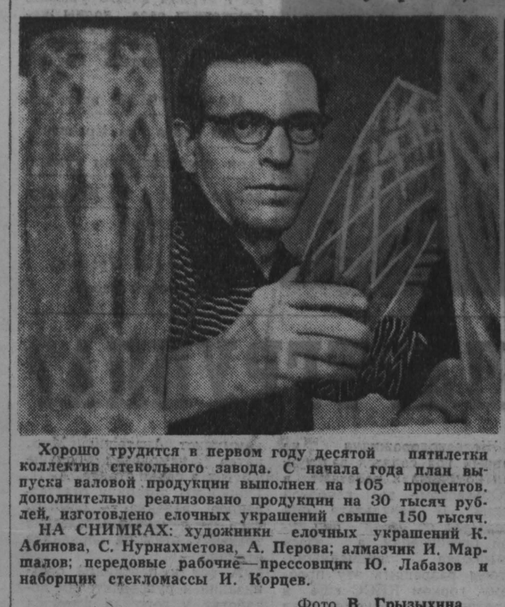
Хорошо трудится в первом году десятой пятилетки коллектив стекольного завода...