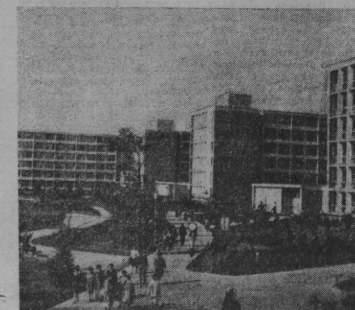
ВУХАРЕСТ. Студенческий городок в районе Грозвешей. Для плодотворной учебы и отдыха будущих специалистов здесь созданы все условия.

Печальные времена настали для карнизов моды и других любителей модных вещей. Их место прочно занял карнизов велосипед.