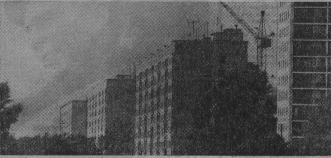
Чтобы рассмотреть его поближе, со всех точек зрения, наш корреспондент взял восемь интервью...