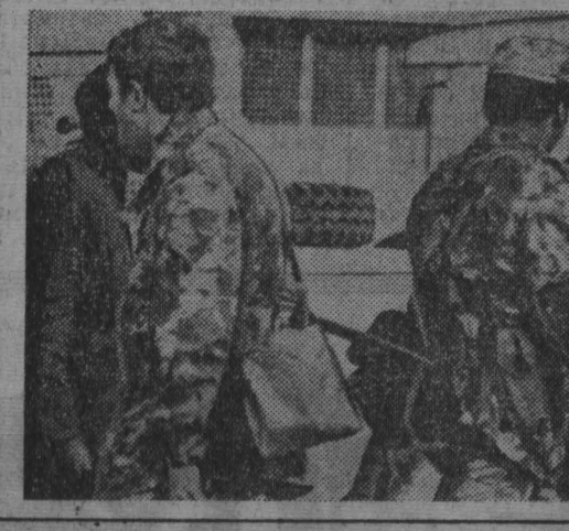
Волна антирасистских выступлений африканцев, охватившая Суэц и всю провинцию Трансаваля, вырвалась за ее пределы и распространилась на ЮАР.

Как известно, заражение этого района произошло в результате аварии на химическом заводе «Имеза», принадлежащем крупной швейцарской компании. Десятилетиями получали серьезные отравления, погибли домашние животные, зарыта растительность. Как полагают эксперты, пораженная газом территория в течение нескольких лет будет оставаться непригодной для проживания людей.