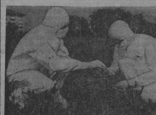
Все более тревожное положение складывается в порожимой ядовитым газом зоне итальянских городов Севезо и Меда близ Милана.

Как известно, заражение этого района произошло в результате аварии на химическом заводе «Имеза», принадлежащем крупной швейцарской компании. Десятилетиями получали серьезные отравления, погибли домашние животные, зарыта растительность. Как полагают эксперты, пораженная газом территория в течение нескольких лет будет оставаться непригодной для проживания людей.