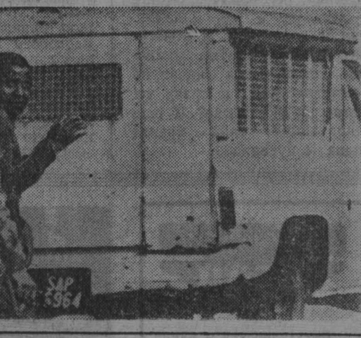
Волна антирасистских выступлений африканцев, охватившая Суэц и всю провинцию Трансаваля, вырвалась за ее пределы и распространилась на ЮАР.

Жертвами новой кровавой расправы на рателей в поселках Ланга, Гугулет и Ньянга стали свыше 50 африканцев.