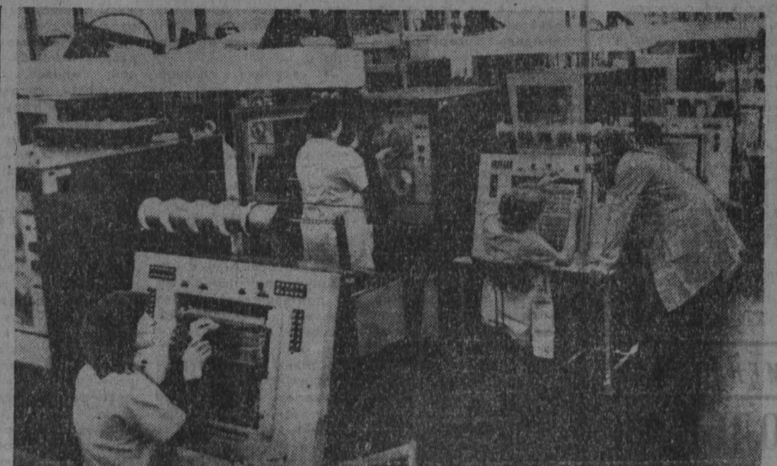
Электронно-вычислительные машины «ЕС-104» производят древильский комбинат «Роботра». Вместе с другими социалистическими странами Германская Демократическая Республика принимает участие в создании компьютеров для единой системы ЭВМ в рамках Совета Экономической Взаимопомощи.

РИМ. Корр. ТАСС В. Мальшев передает. Здесь состоялось специальное заседание Совета министров, на котором обсуждалось тревожное положение сложившееся в итальянских городах Севезо и Меда на севере страны.