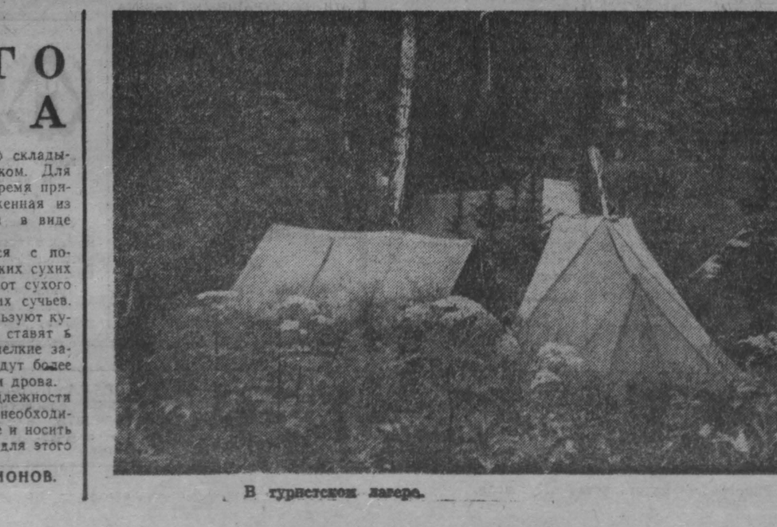
В гурьевском лагере.

ТУРИСТУ НА ЗАМЕТКУ У ТАЕЖНОГО КОСТАРА Костры бывают разные: плавильные — для приготовления пищи, освещения бивуака, сушки одежды, снаряжения; дымовые — для сигнализации и защиты от комаров. По способу укладки дров костры различаются на несколько видов. Самый распространенный — «ежешка». После раскладки поленьев укладываются в ряд с небольшими промежутками. На них кладут второй ряд, а иногда третий и четвертый. Известен и другой вид костра — «холодный», но он дает меньше жара. Для сушки вещей, когда надо много тепла, незаменим таежный костер из толстых поленьев длиной до двух метров. Для приготовления пищи в одном котелке удобно складывать костер шалашиком. Для покевки в холодное время применяется ноля, сложенная из толстых сухих лески в виде стелки. Костер разжигается с помощью растопки: мелких сухих еловых веток, щепок от сухого пня, стружки от сухих суевей. В смурную погоду используют кучок сучья, который ставят в центр раскладки. На мелкие загоревшие ветки кладут более толстые сучья и затем дрова. Костровые принадлежности для полески котлов необходимо изготовить заранее и носить с собой, а не рубить для этого живые деревья. Ю. ИОНОВ, г. Кемерово.