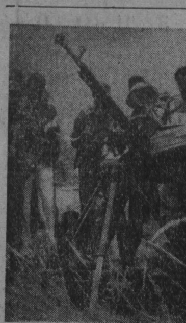
НАРОДНАЯ РЕСПУБЛИКА МОЗАМБИК, которая обрела свою независимость в результате победоносной борьбы мозамбикского народа под руководством ФРЕЛИМО и при поддержке прогрессивных сил Африки и всего мира, полна решимости защищать свои границы от вооруженных провокаций и агрессии со стороны южноафриканских расистов.

На нынешней стадии переговоров, заявил он, Советский Союз и США добились значительного прогресса со времени проведения владивостокской встречи на высшем уровне.