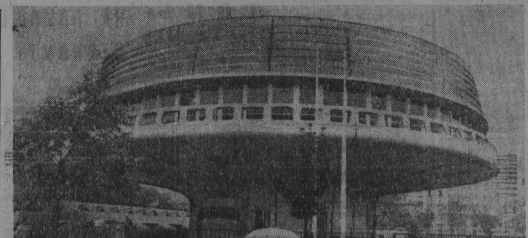
«ШАМПИньОН» ДЛЯ 1000 АБОНЕНТОВ. БОЛЕЕ тысячи абонентов будет обслуживать новая телефонная станция, строительство которой ведется на улице Мюра в Париже. Построенное из бетона в форме огромного гриба, здание вступит в строй в будущем году.