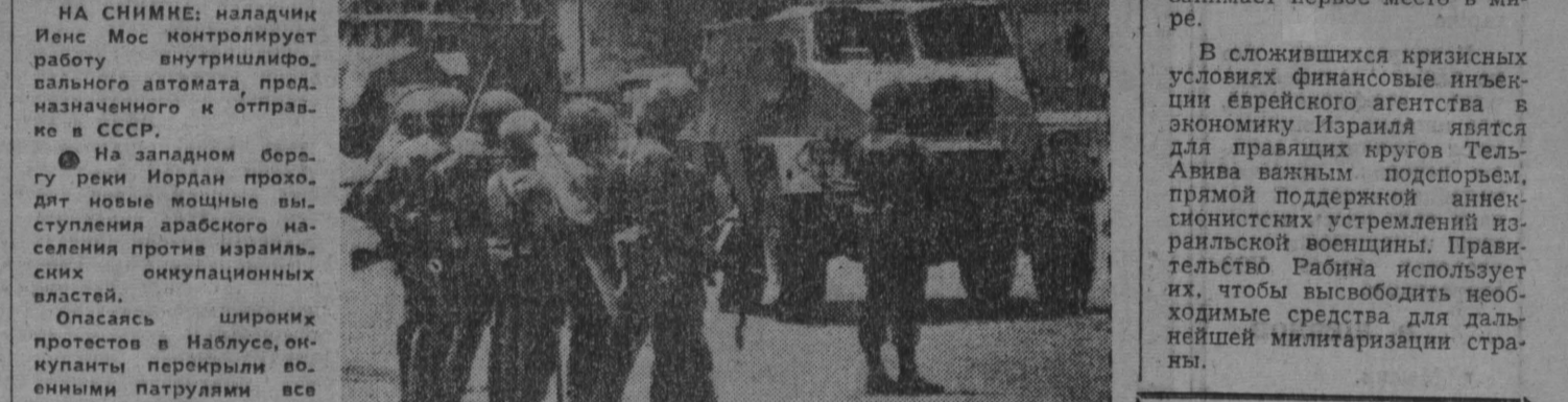
На снимке: израильские патрули на улицах Наблуса.