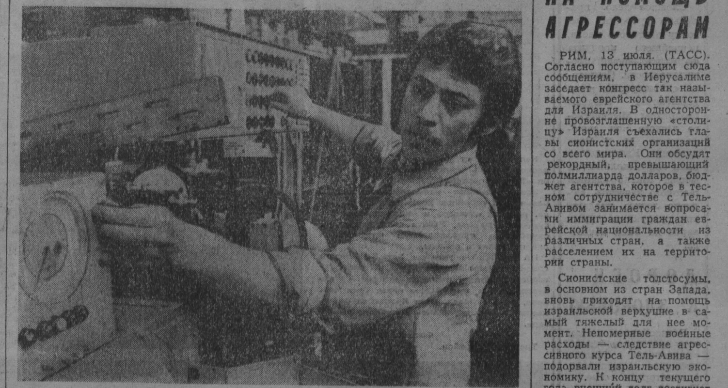
Семердцат процентной продукции, изготовляемой заводом металлургического комбината «Альбамайн» в Марциане (ГДР), находится в государственном хозяйстве СССР.