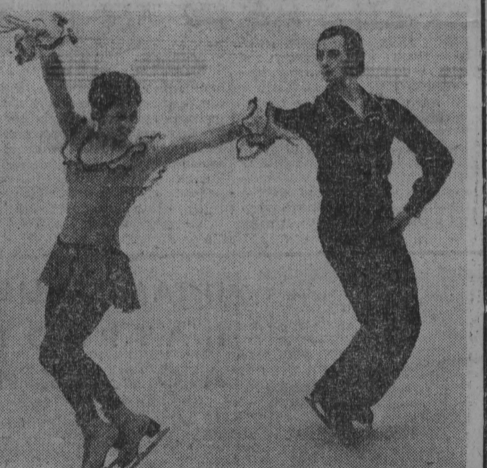
сборную команду СССР по фигурному катанию Ирина Роднина и Александр Зайцев, Людмила Пахомова и Александр Горшков.