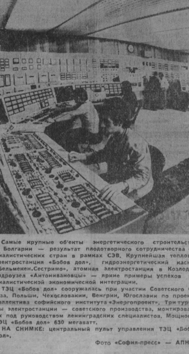
Самые крупные объекты энергетического строительства в Болгарии — результат плодотворного сотрудничества социалистических стран в рамках СЭВ. Крупнейшая тепловая электростанция «Бовов дол», гидроэнергетический каскад «Бельмемне-Сестрими», атомная электростанция в Колязуде, гидроузлы «Антонивановци» — яркие примеры успехов социалистической экономической интеграции.

Дипломатический сезон 1976 года в Европе открылся визитом в Москву заместителя премьер-министра, министра иностранных дел Финляндии Калеви Сорса. Это событие привлекает к себе внимание не только важным значением каждого советско-финляндского контакта, но и тем, что оно произошло в тот момент, когда один внешнеполитический год передавал эстафету другому.