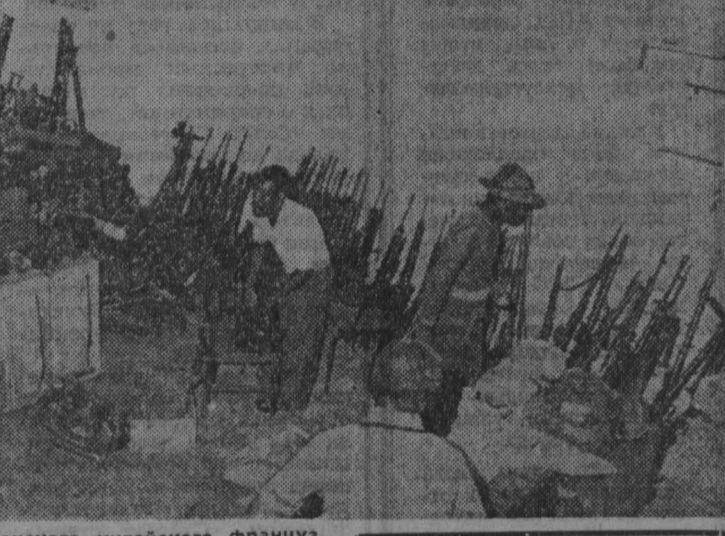
Оружие и боеприпасы американского, китайского, французского производства, а также некоторые другие страны НАТО, доставленные наступавшей Народной армией Республики Ангола.

БОМН. «Друзья» поневоле так можно назвать общество, которое создано в западногерманском городе Шлюхтерн.