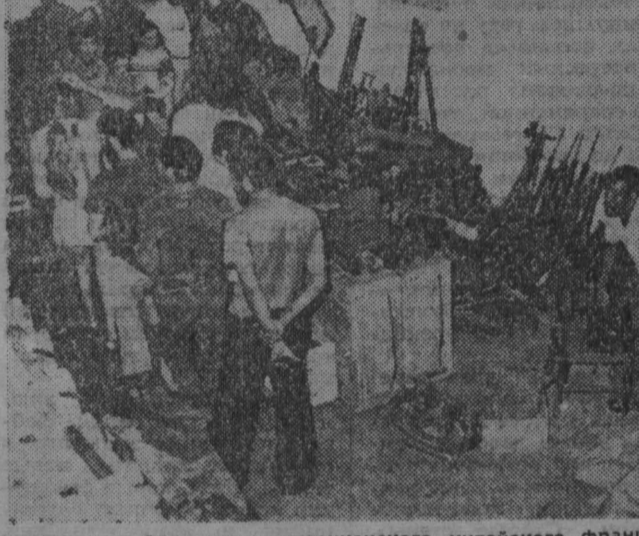
Оружие и боеприпасы американского, китайского, французского производства, а также некоторые другие страны НАТО, доставленные наступавшей Народной армией Республики Ангола.

БУДАПЕШТ. Складная палка с наконечником в форме башура — вот все нехитрый инструмент чепухаристов мастеров, которые зажигают и гасят последние 575 газовых фонарей, приносящих неповторимый колорит улицам Будапешта.