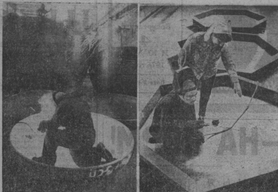
Нефтехимическая аппаратура, фильтры для щинной и сажевой промышленности, воздухоочистители и многое другое оборудование для химической промышленности выпускает Кемеровский завод химического машиностроения...