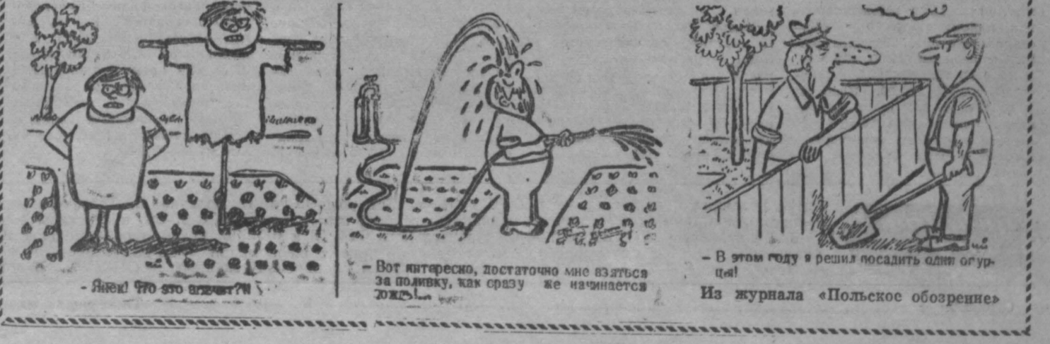
— Яшка? Это кто? —