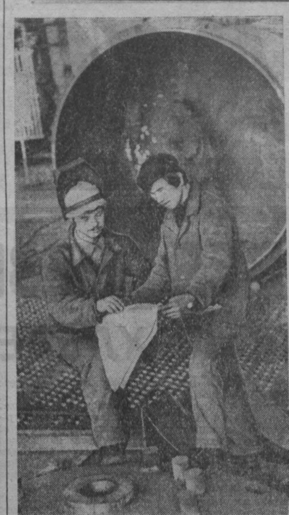
Сборочный цех — один из ведущих на Кемеровском заводе химического машиностроения.

что, если при партноме иметь постоянную комиссию, которая, не подменяя цеховые партийные организации, оказывала бы им методическую и организационную помощь в проведении комплекса воспитательных мероприятий и была бы для парткома источником постоянной информации? Совет профилактики для этого не годится. Во-первых, права и обязанности его четко не определены. К тому же совет профилактики, разбирая поступки нарушителей, на мой взгляд, несколько подменяет трудовые коллективы, товарищеские суды, цеховые, принижая их роль. От этого страдает круг лиц, участвующих в воспитательной работе. А наказать виновного на совете профилактики нельзя: нет прав. По-моему, не умаляя роли совета профилактики, упор в воспитательной работе нужно сделать на трудовой коллектив, социальные функции которого все больше возрастают. От того, насколько он будет зрелым и требовательным к своим членам в вопросах коммунистической морали и политической сознательности, настолько будет высокой их трудовая и общественная активность. И добиться наибольшей отдачи всех мероприятий непосредственно в коллективах — одно из главных направлений в работе парткома. Хотелось бы узнать, как поставлено дело в этом отношении в других парторганизациях. П. ИВАНЕНКО, член парткома Топкинского механического завода, редактор многотиражной газеты «Голос труда», г. Топки.