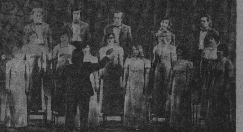
РИЖСКАЯ ТЕЛЕСТУДИЯ — ЗРИТЕЛЯМ КУЗБАССА