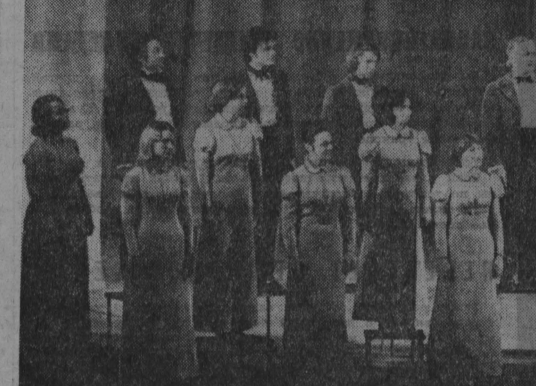
В ВСТРЕЧЕ С ПРЕКРАСНЫМ ХРОНИКА ДНЕЙ КУЛЬТУРЫ