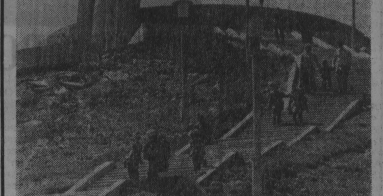
♦ МОНОЛЬСКАЯ НАРОДНАЯ РЕСПУБЛИКА. Момент советским войнам на горе Зайсан.