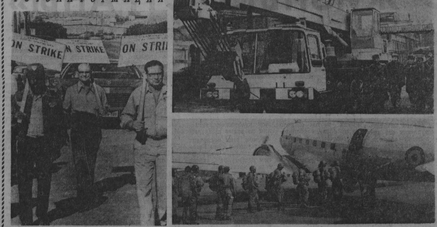
Трудящиеся США все решительнее выступают против наступления монополий, за свои жизненные права, повышение заработной платы, гарантии занятости при на труде.