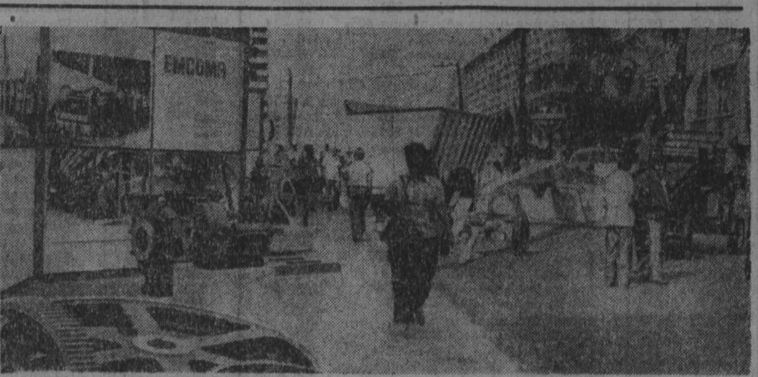
В самом центре Гаваны на открытии выставки достижений кубинской революции. На ней представлены экспонаты, макеты, фотографии и документы, рассказывающие о борьбе кубинцев за свободу и независимость, об успехах в различных областях хозяйства, культуры и науки.

БЕИРУТ. Корр. ТАСС А. Ураво передает: Положение в Ливане продолжает оставаться крайне напряженным. Вооруженные столкновения принимают все более широкий размах и охватывают новые районы. В последние сутки боевые действия между подразделениями Орталантики, национально-патриотических сил и вооруженными формированиями правых партий происходили во всех восточных пригородах Бейрута и в центральных районах столицы. Прошедшей ночью сильный пожар возник в морском международном порту. Все здания из столицы остаются блокированными.