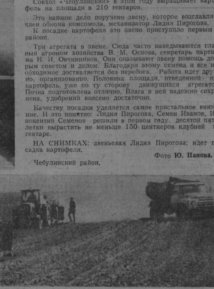
Совхоз «Чебулинский» в этом году выращивает картофель на площади в 210 гектаров.