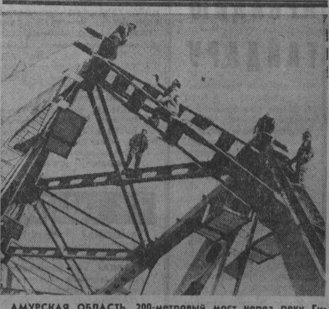
АМУРСКАЯ ОБЛАСТЬ. 200-метровый мост через реку Гюлюй — один из самых больших на Байкало-Амурской магистрали...