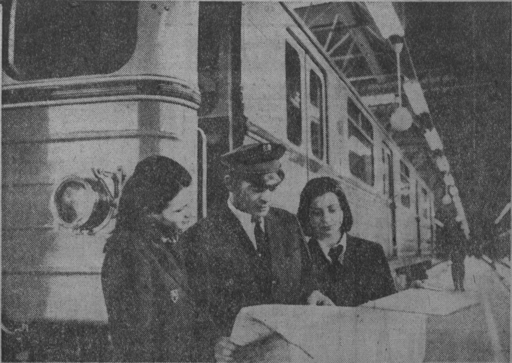
Вагоны, сделанные на предприятиях Советского Союза, будут обслуживать строящуюся линию будущего метро «Север-Юг».