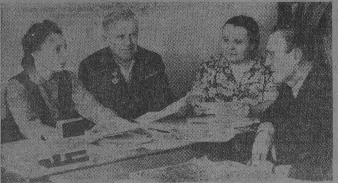
Много добрых помощников у коллектива редакция газеты «Огни шахты». Это и молодые работники, и ветераны, которые сотрудничают в газете по 15—20 лет. Отдельно часто поручают им разбираться с письмами трудящихся, писать о людях города. Вместе с журналистами работники организуют встречи горняков, строителей, работников сферы быта за круглым столом.