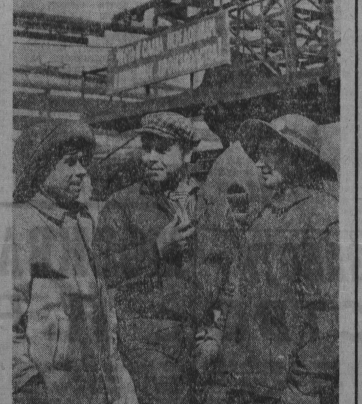
Достоин встречает Первой коллектив комсомольского цеха Кемеровского завода. В социалистическом соревновании среди цехов завода он завоевал первенство. На сверхплановом счету коллектива более 350 тысяч кубических метров моногаза и 250 тонн коксовой продукции.

ОТ РЕДАКЦИИ. Материал был в номере, когда мы позволили в цех. А там пошла телеграмма министру: он передал просьбу работников сельского хозяйства Башкирии выработать дополнительно стимулятор. Директор завода спросил аппаратчиков, что они ответят. Решено: дать «лишние» 500 тонн стимулятора, почти на треть больше плана. Это очень трудно. Это первое испытание для авторов личных планов. Удачи им!