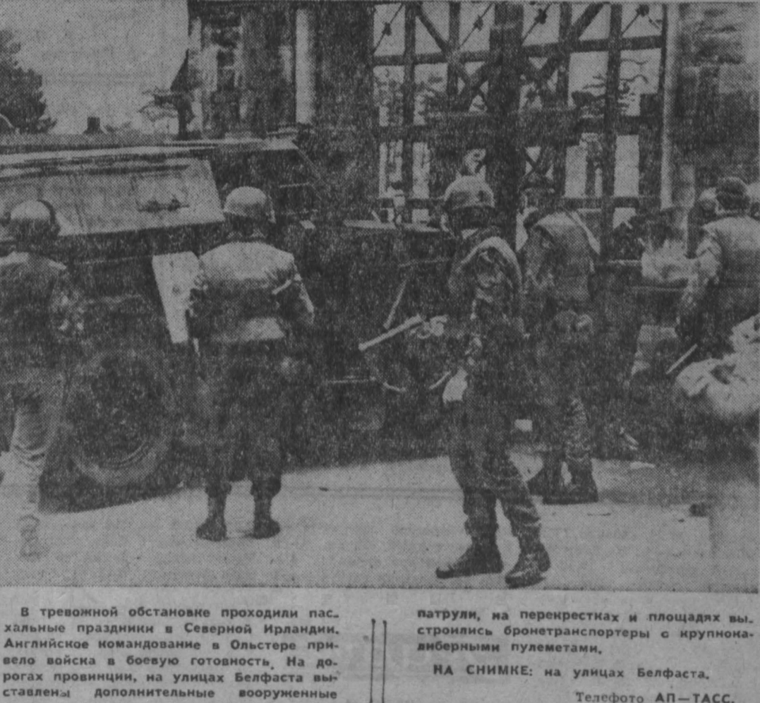
В тревожной обстановке проходили пасхальные праздники в Северной Ирландии. Английские командование в Ольстере привело войска в боевую готовность. На дорогах провинции, на улицах Белфаста выставлены дополнительные вооруженные патрули, на перекрестках и площадях выстроились бронетранспортеры с крупнокалиберными пулеметами.