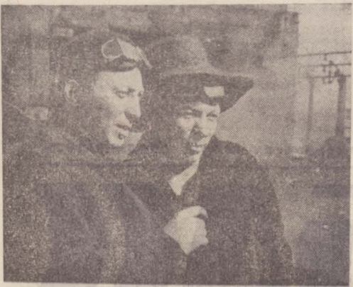
По ударному труду в честь 30-летия Победы над гитлеровской Германией. Коллектив цеха выдал сверх задания в этом году 18 тысяч тонн кокса и передал потребителям около 18 миллионов кубических метров коксового газа.

Принимать избирателей по вопросам, связанным с подготовкой и проведением выборов, производится ежедневно с 12 до 20 часов. Телефоны: 6-87-30, 6-75-44.