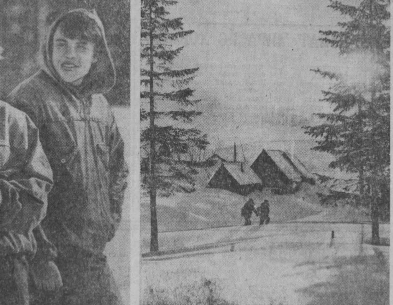
УТРО В ПОСЕЛКЕ УСТЬ-АРКАРЫ.