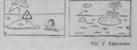
Рис Г. Ефремова.