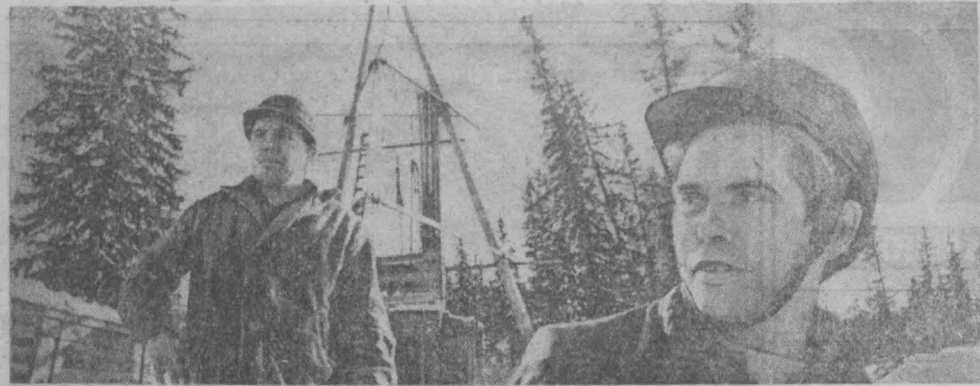
СЕГОДНЯ — ДЕНЬ ГЕОЛОГА