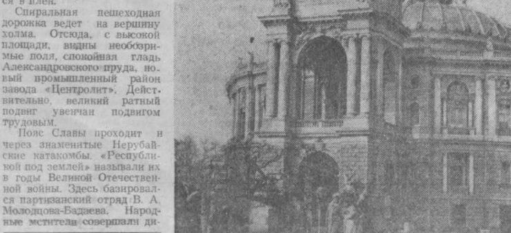
НА СНИМКЕ: Одесский государственный академический театр оперы и балета.

Корабельной сирени бонисает звук, Тучи кружатся листья платанов. Здравствуй, юность моя, — город встреч и разлук, Молодых и седых капитанов.