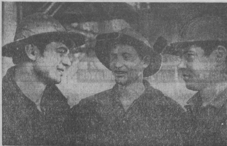
Плакатчики комсомольско-молодежной линии № 5 — неоднократные победители среди молодежных коллективов на Кузнецком ферросплавном заводе...