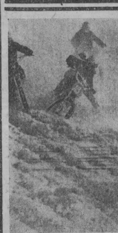
Дрогнул враг, побежал. Натяг, гад, не сдержал. Зорек третья сибирской бригады.