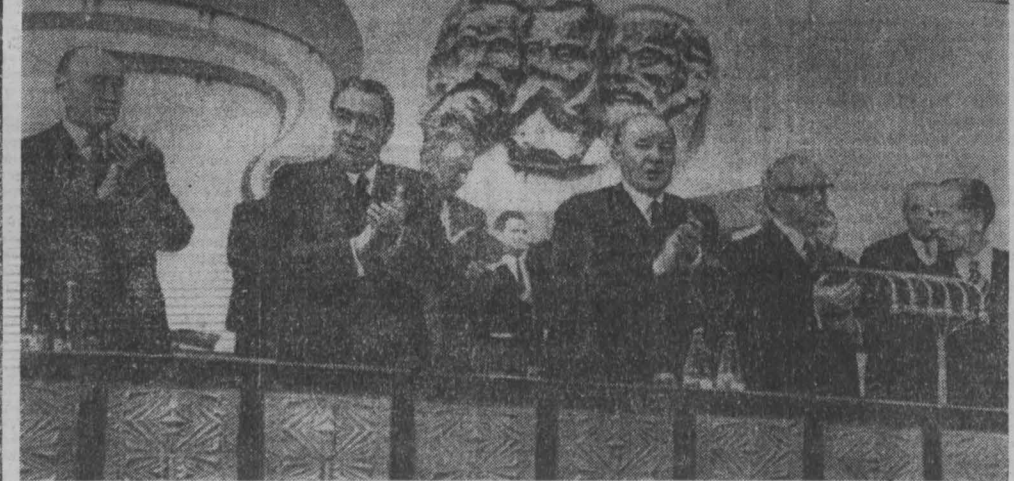
17 марта в Будапеште во Дворце профсоюза строителей открылся XI съезд Венгерской социалистической рабочей партии. На снимке: во время открытия съезда. (Снимок принят по фототелеграфу).

Горняки бассейна активно работают над дальнейшим техническим перевооружением угольных предприятий, внедрением прогрессивного опыта. Это позволило с начала года план по производительности труда в целом по бассейну выполнить на 100,5 процента, увеличить ее к соответствующему периоду прошлого года на шесть процентов.