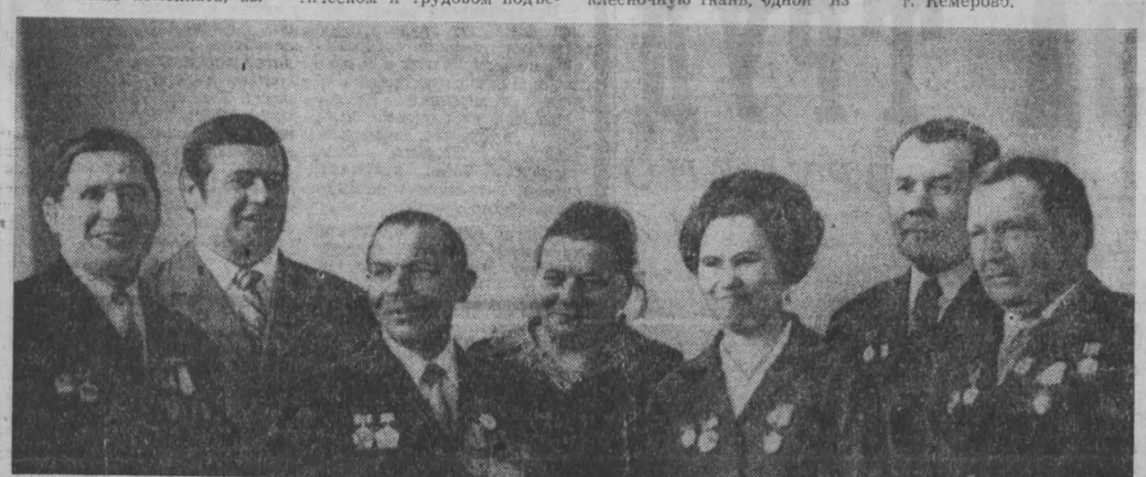
г. Кемерово.