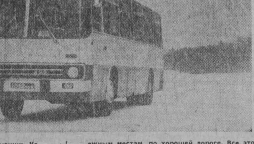
На карте маршрутов, связывающих Кемерово с отдаленными населенными пунктами, прибавился еще один, томфор-табельный «Инарбус» — считанные часы доставит немеромван в Новосибирск. Транспортная служба через Юргу-II, ст. Болотная, с. Мошное по живописным та-