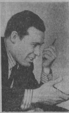
Девятую пятилетку мы встретим так: в подземных выработках на 70 процентов переключат пути. Легкие рельсы заменили современными Р-33. Расширили электродорожки. Прошли полевые шпекри. Больше половины выработок крепим анкером. Уже была опробована система: во всем очистным и подготовительным работам прокладывать путь для доставки оборудования и материалов. Сеть путей и погрузочных средств расширилась, и на поверхности: установлен семь погрузочных кранов.

Еще в 1969 году коллектив шахты стал инициатором соревнования среди горняков коллективов города под девизом: «Горной технике — широкое применение». У нас было моральное право на призы. Из инженерно-техников, горнорабочих сложилась творческая группа. Рационализаторы, механизаторы ручные операции, решали и крупные проблемы. Занимались усовершенствованием комплексов, разработали конструкцию проходческого комбайна. Позже мы его сделали из списанного серийного оборудования — деталей и узлов крана КМ-87, ОМП, рабочего органа 4ПУ. Он отличался от существующих ранее конструкций тем, что позволяет проводить выработку как горизонтальные, так и наклонные. Агрегат устойчив, прост в эксплуатации и управлении. Темпы же проходки на нем выше, чем у ПК-3. Сейчас комплекс, названный «Кузбассом».