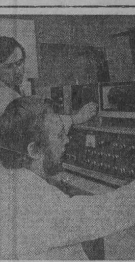
БОГАРИЯ. С каждым годом расширяется сотрудничество между академиями наук СССР и НРБ. Группой болгарских и советских ученых-биофизиков создан специальный спектродетектор, предназначенный для наблюдения и регистрации быстрых фотоэффектов.

Организация ФКП, говорится в заявлении, примет активное участие в эффективном претворении в жизнь этих решений, а также в обеспечении успешного проведения по всей стране совместных митингов, значительных постоянных комитетов связи левых сил.