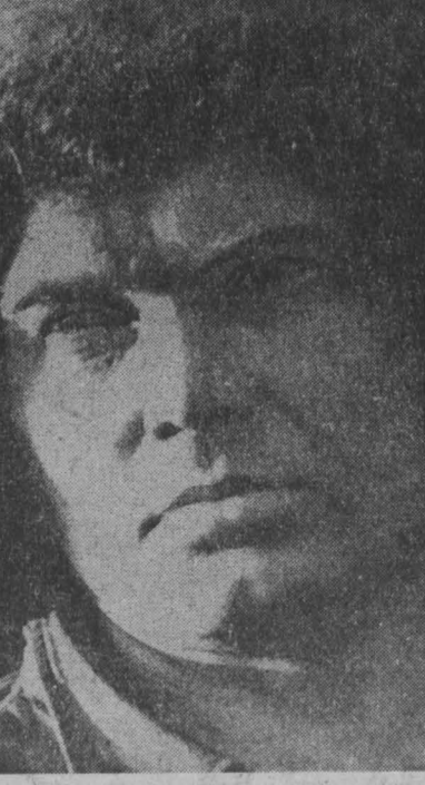
Начал, в которой он трудится, всегда на хорошем счету в цехе. г. Новокузнецк.