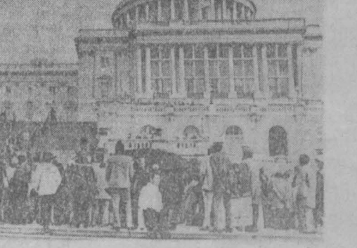
Вашингтон. «Нам нужна работа», «У нас нет денег, чтобы кормить семью» — под такими лозунгами у конгресса США состоялась массовая демонстрация рабочих, выброшенных за ворота предприятий. Сотни безработных собрались в американской столице из штатов Нью-Йорк, Нью-Джерси, Пенсильвания, Вирджиния, чтобы потребовать от федеральных властей принятия неотложных мер по ликвидации создавшегося положения. НА СНИМКЕ: участники демонстрации у стен Капитолия.

Одной из важнейших обязанностей Союза коммунистов Югославия, сказал далее И. Броз Тито, является повышение идейного уровня и воспитание членов партии. Вопросам идеологического строительства Союза коммунистов и воспитанию членов партии необходимо уделять еще большее внимание.