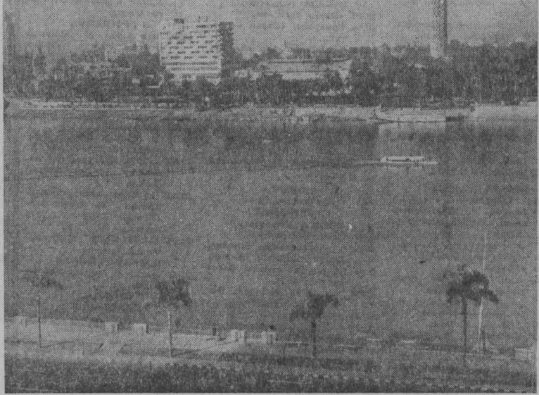
Набережная реки Нил в Каире.

КАИР. Генеральный секретарь Лиги арабских стран М. Риад направил министрам иностранных дел арабских государств приглашение принять участие в работе сессии совета Лиги, которую намечено провести в Каире 24 марта.