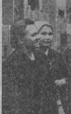
Соревнуясь за качество продукции, за сроки ее поставки, кузнецкие металлурги наращивают объемы производства.