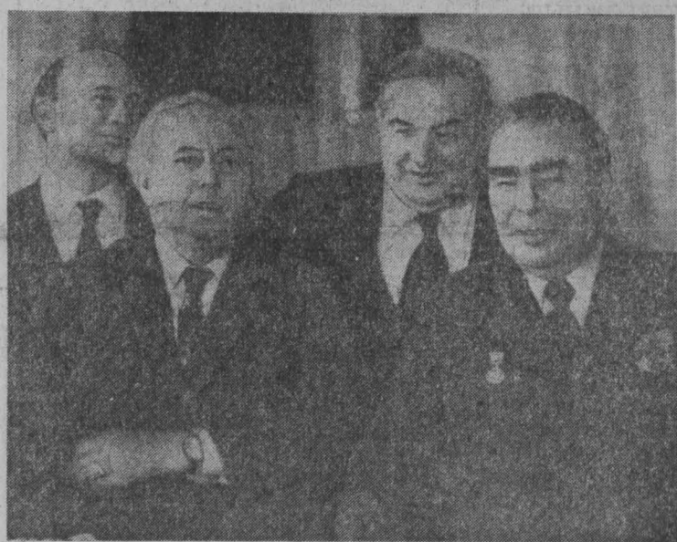
13 февраля в Москву прибыл с официальным визитом Премьер-Министр Великобритании Гарольд Вильсон. НА СНИМКЕ: перед началом переговоров.