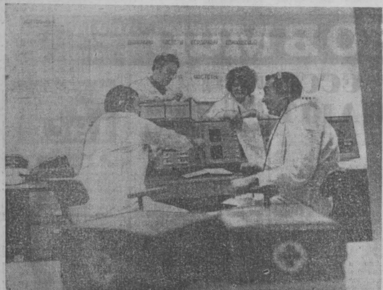
«Глобус»: заметки туриста