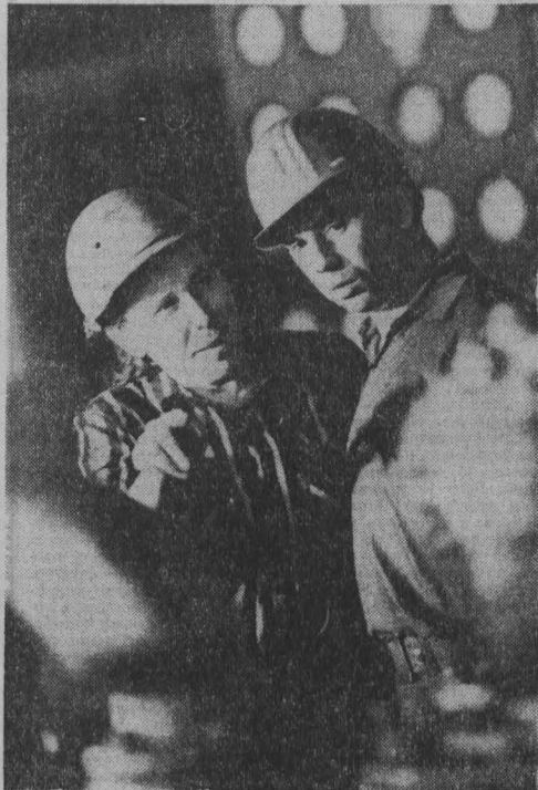
Трудовыми победами встречают свой профессиональный праздник труженники Кемеровской ГРЭС. За годы девятой пятилетки они выработали на своем личном топливе 600 миллионов киловатт-часов электроэнергии. Производительность труда возросла на 25 процентов. От внедрения рационализаторских предложений получено экономический эффект в полмиллиона рублей.