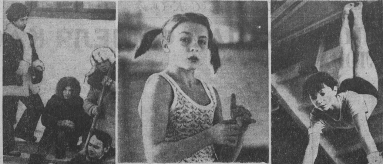
Конкурс на лучшую физкультурную семью