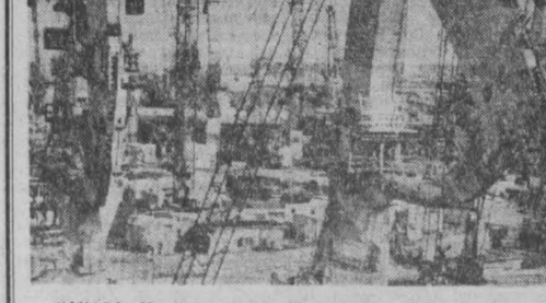
КАНАДА. Монреаль готовится к приему участников и гостей Олимпиады-76. Строится олимпийский стадион. Растут спортивные сооружения. На снимке: на строительстве олимпийского стадиона.

ЦК КПИ отмечает, что установление справедливого и прочного мира, который обеспечит существование Израиля, возможно лишь на основе вывода израильских войск со всех оккупированных в 1967 году арабских территорий, обеспечения законных национальных прав арабского народа Палестины на самоопределение и создание собственного государства, безопасного существования и развития государства данного района. Все больше людей в Израиле начинают требовать изменения авантюристического курса правительства, его перорIENTATION в сторону политического реализма и мира.