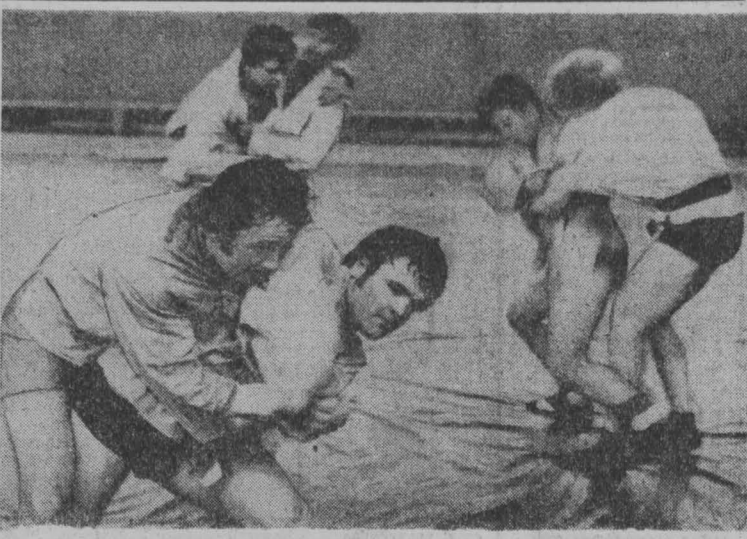
Лишь первый год занимаются борцы в Дворе спорта при областном обществе «Динамо». Но пятеро спортсменов на недавних Всероссийских соревнованиях по вольной борьбе стали лидерами и один — чемпионом России, а все они получили звание мастера спорта.