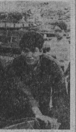
На снимке: воины НВСО у рыбаков в дельте Меконга.

В то же время мы решительно выступаем против того, что буржуазная пресса систематически приписывает значение важнейших документов, которые были приняты в Хельсинки, поддержке Духу Хельсинки противоречат и выступле-