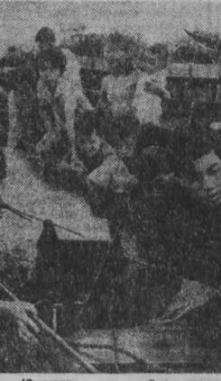
В прибрежных провинциях Южного Вьетнама успешно развивается промысел. Революционная администрация оказывает содействие в восстановлении деятельности крупных рыболовецких хозяйств.

Один из основных вопросов повестки дня съезда — обсуждение проекта новой конституции Республики Куба, который после одобрения его съездом будет внесен на всенародный референдум. Важное место в работе съезда занимает проект директивы первого пятилетнего плана развития народного хозяйства Кубы на 1976—1980 годы. Съезд примет устав КП Кубы, избрав руководящие партийные органы.