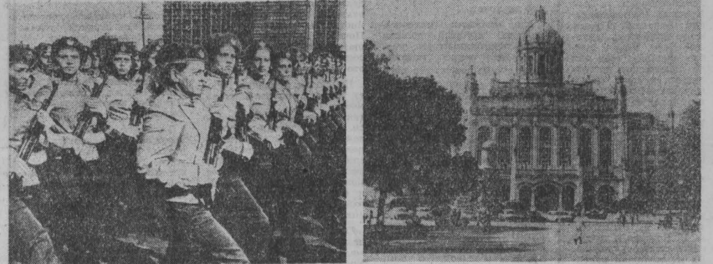
Участники съезда Компартии Кубы в павильоне Гаваны.