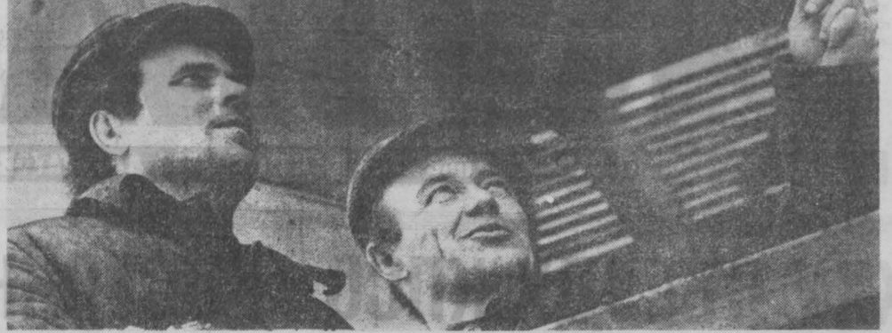
Коллектив азотно-тукового завода Кемеровского завода имени В. И. Ленина.