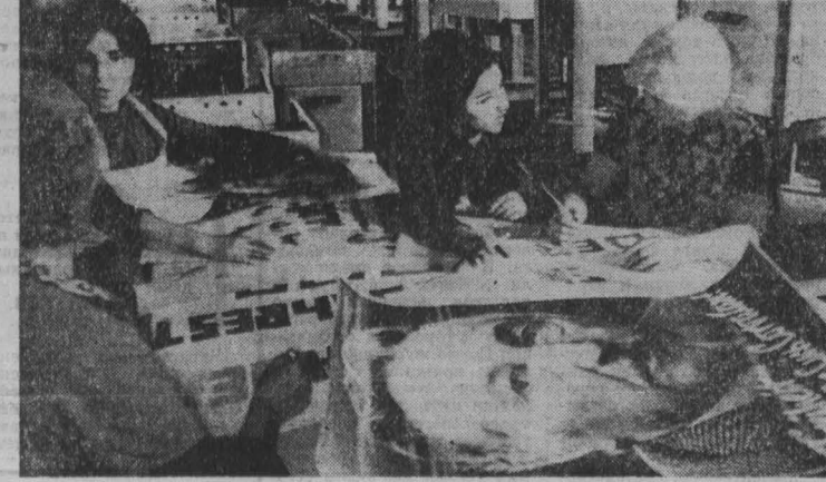
«Свободу Луису Корвалану» — требуют на этих планатах работники комбината «СКЕТ» в Магдебурге, среди которых — чилийские патриоты, обрешине в ГДР свою вторую родину. (Фотография с международной выставки «Ненцина и социализм», организованной в Берлине информационными агентствами социалистических стран, АДН—ТАСС.

рипблик», уже с ноября американские артиллерийские орудия и бронетранспортеры без лишнего шума разгружаются в ангольском порту Лобунду, захваченном силами расколовшихся. Журнал отмечает, что мятежники, которые пользуются поддержкой вьетнамцев, получают от США и другое современное оружие. Газета «Криччен сайенс монитор» обращает внимание на попытки правительства добиться от конгресса ассигнований на военную помощь Зану в размере 19 млн. долларов, указывая, что эти средства пойдут на поддержку мятежников в Анголе.