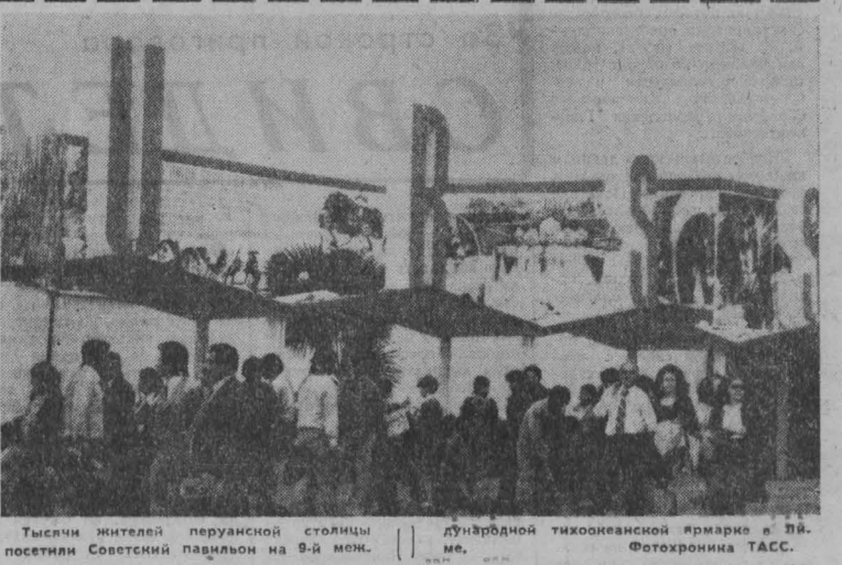
Тысячи жителей перуанской столицы посетили Советский павильон на 9-й меж. дундэрбонд тихоокеанской ярмарки в Лима.

Об эффективности такого метода обучения можно судить на примере учебно-производственного комбината Заводского района г. Кемерово, где в 1974—1975 учебном году окончено обучение 1.230 учащихся. Из них почти учиться или работать по тем специальностям, которые они получили в комбинате, 787 человек, что составило 64 проц. от общего числа обучающихся. Важным средством трудового воспитания мы считаем летние лагеря труда и отдыха старшеклассников. Только в 1975 г. в области работало 58 таких лагерей, где трудились и отдыхали 20 тыс. учащихся. Значительное участие в воспитательной работе по благоустройству городов и рабочих поселков, в ремонте школьных зданий. Вместе с тем следует отметить, что в обучении и воспитании детей и молодежи нам приходится встречаться и с серьезными проблемами, решение которых требует постоянного внимания не только местных советских органов, но и республиканских министерств и ведомств.