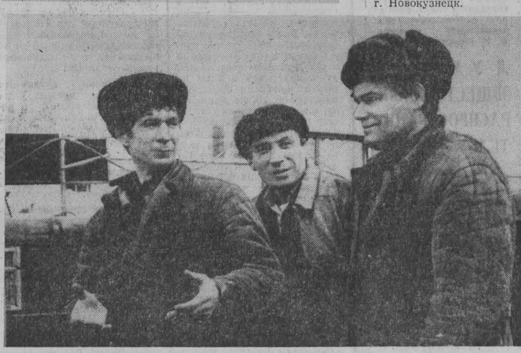
Фото В. Володина, г. Новокузнецк.