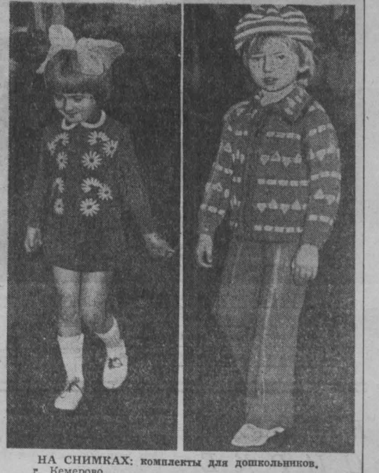
НА СНИМКАХ: комплекты для дошкольников, г. Кемерово.