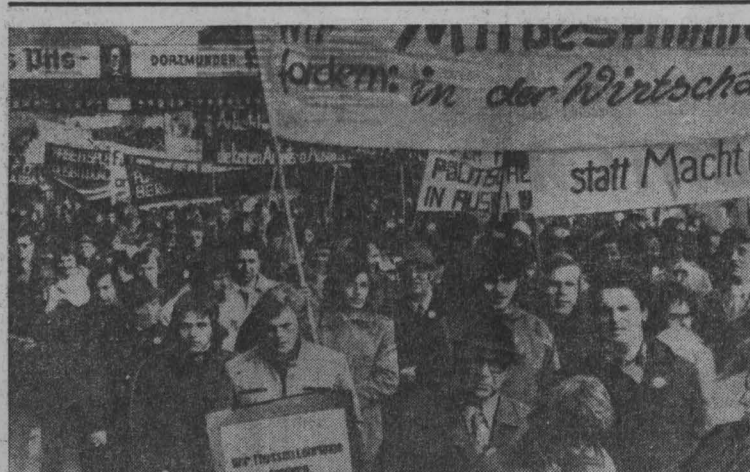
ДОРТМУНД. Десятки тысяч западно-германских трудящихся приняли участие в демонстрации, состоявшейся в этом крупном промышленном центре.

Вступают в забастовку в связи с ростом стоимости жизни в стране. (ТАСС).