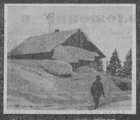
Из дневника синоптика