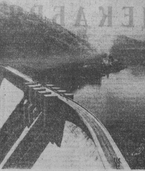
В Болгарии завершено строительство крупного национального объекта — гидроузла «Антонияновца», составной части гидроэнергетического каскада «Доспад-Вича». Этот гидроузел (на снимке) сооружен с помощью Советского Союза.