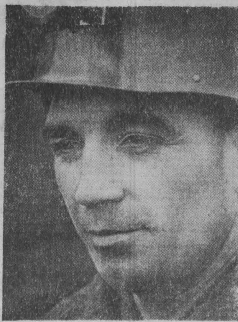
Горняки производственного объединения «Южкузбассуголь» досрочно выполнили пятилетний план угледобычи.