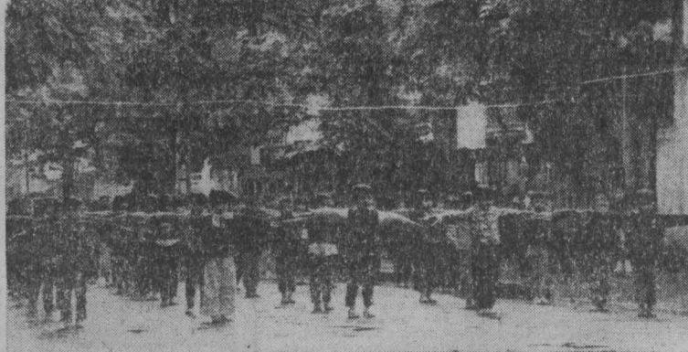
Впервые за многие десятилетия Вьетнам живет в обстановке мира и спокойствия. С улиц его городов исчезли бомбежки. Дети Вьетнама, надежда и будущее страны, живут и учатся под мирным небом.