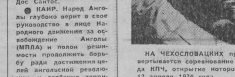
НА ЧЕХОСЛОВАЦКИХ предприятиях развивается соревнование в честь XV съезда КПЧ, открытие которого назначено на 12 апреля 1976 года.

ДЕЛИ, 21 ноября. (ТАСС). По инициативе Индо-советского культурного общества в городе Берхампур, штат Западный Бенгалия, был открыт памятник В. И. Ленину. В многочисленном митинге по случаю открытия памятника принял участие представитель партии Индийский национальный конгресс, КПИ, молодежных организаций.