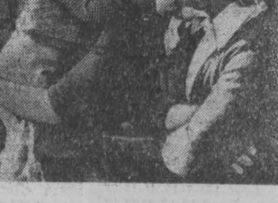
НА СНИМКЕ: во время одной из демонстраций рабочих текстильной фабрики в Болсееке. Фото ЦБ—АПН.

НЬЮ-ЙОРК, 10 ноября. (ТАСС). Как здесь стало известно, председатель Комитета Генеральной Ассамблеи ООН по социальным, гуманитарным и культурным вопросам (третьим номером) обратился к чилийской хунте с просьбой воздержаться от заключения генеральному секретарю Компартии Чили Лусию Корваллану выехать на похороны своего сына. Однако хунта отказала в этой просьбе.