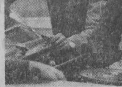
Идет самая объективная информация о поведении «Жигулей» на разном роде дорог, о случаях неожиданного выхода на строя какой-то определенной детали. Специалисты завода, изучая сигналы датчиков, стремятся увеличить срок службы узлов и деталей машин, повышать их качество. В конечном счете выигрывает владелец «Жигулей».

ЕСТЬ В ОБЛАСТНОМ ЦЕНТРЕ СПЕЦИАЛИСТЫ, которые постоянно живут в Кемерове, а работают в... Тольятти, на Волжском автозаводе. И ничего удивительного в том нет: молодая фирма «А в т о В А З» техобслуживание, чтобы не терять связи с машинами, что сошли с конвейера В А З а, держат своих дозорных, своих представителей в разных районах страны. Именно эти специалисты на станциях технического обслуживания в городах, на за-