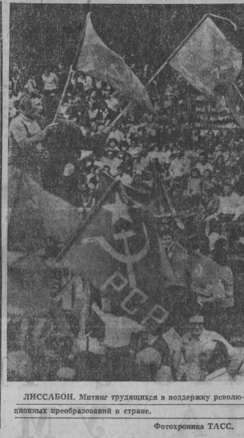
ЛИССАБОН. Митинг трудящихся в поддержку революционных преобразований в стране.

Вандунгский «административный рейд», как называет агентство АНТАРА проведенную операцию органов безопасности, свидетельствует о растущем скрываемом проникновении в страну лиц китайской национальности, в том числе и нелегальных эмигрантов из КНР. Летом нынешнего года в Бандунге властями был раскрыт подпольный синдикат, который под прикрытием туристской фирмы в широких масштабах осуществлял нелегальную переброску через Гонконг в Индонезию граждан из Китайской Народной Республики. Среди них, как подчеркнул представитель органов безопасности, было немало лиц, прошедших в Китае специальную подготовку.