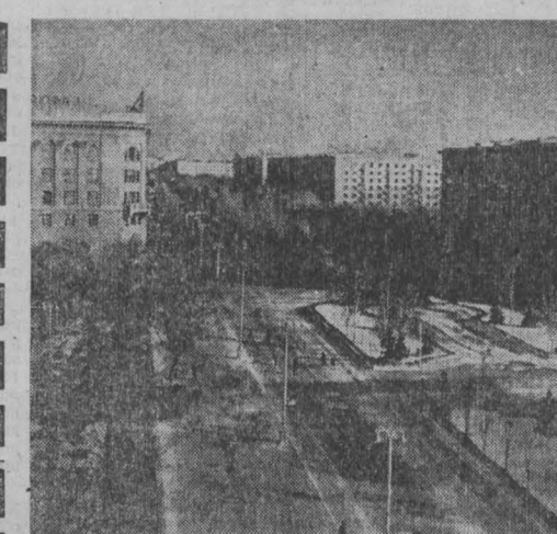
Город-герой Волгоград. Проспект имени В. И. Ленина.

Улицы Томска украшены огромными разноцветными панно, рекламой, которая сообщает, что скоро открывается зональная художественная выставка «Сибирь социалистическая». Красивый Дворец спорта переоборудован под выставочный зал. Группа новосибирских художников разработала проект специального оформления, которое поможет не только сделать посещение удобным для зрителей, но и выполнит эстетические функции — образно отразит девиз выставки: многообразный показ жизни современной индустриальной Сибири. Пока идет оформление зала, фойе Дворца, в служебных помещениях уже две недели напряженно работает зональный выставочный зал. Организация Союза художников восьми областей зоны привезла на просмотр шесть тысяч работ. Экспозиция же сможет принять несколько сот произведений. Так уж случилось, что