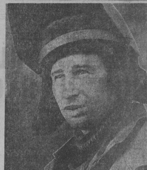
Фото Ю. Сергеева. г. Новокузнецк.