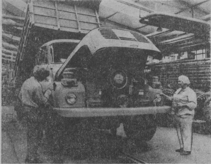
Более чем в 30 стран мира экспортируются такие тяжелые грузовики знаменитой чехословацкой марки «Татра»...