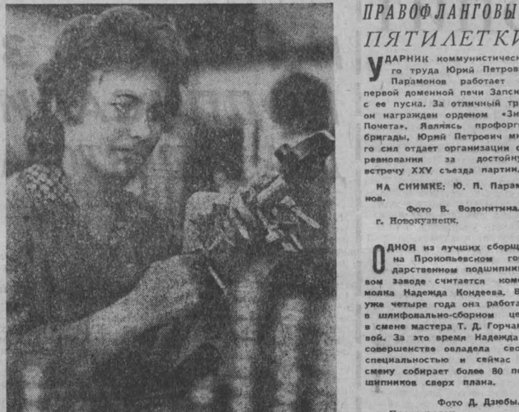
г. Новокузнецк.