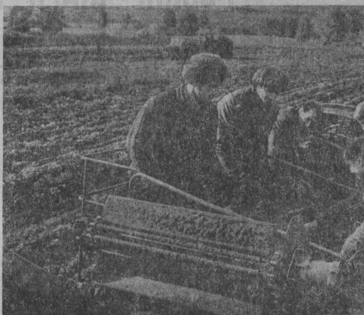
Кемеровский район.