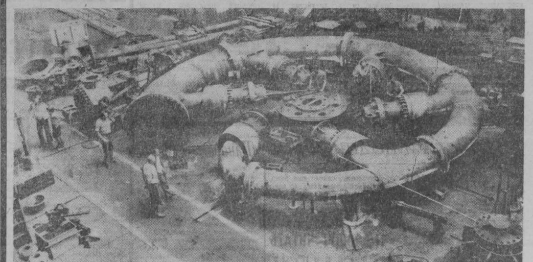
НА СНИМКЕ: в цехе венгерского машиностроительного комбината «Ганц-МАВАГ», выполняющем заказ Индии на изготовление гидравлической турбины мощностью 50 тысяч киловатт для гидроэлектростанции в Шамане.