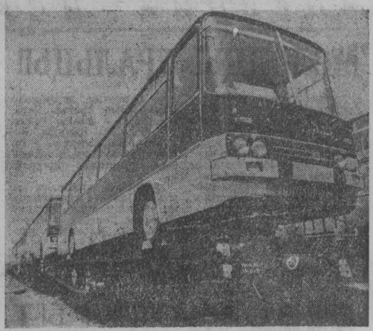
Шесть тысяч автобусов ежегодно будет поставлять венгерский завод «Икарус» в Советский Союз. НА СНИМКЕ: партия автобусов «Икарус-250», подготовленная к отправке в СССР.