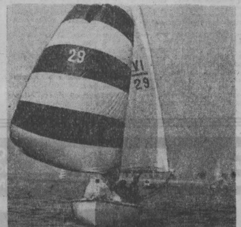
ЧЕБОНСАРЫ. Во Всесоюзной гонке ирейверских яхт на Кубок Волги, стартовавшей из Горького, принимают участие спортсмены десяти городов. Под парусами они проедут 600 миль. Финиш в Тольятти.