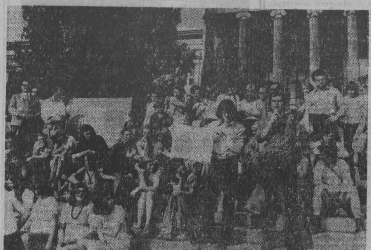
Луиса Корвалана и всех подзаключенных. НА СНИМКЕ: перед зданием Государственного музея в Шерине (ГДР), где была организована выставка-продажа картин и графики художников ГДР и других стран, средства от продажи которых передаются в фонд солидарности с народом Чили.

нужд просвещения», — заявил представитель национальной федерации работников просвещения Франции. ♦ АФИНЫ. В городе Салоники открылась 40-я Международная торговая-промышленная ярмарка, в которой принимают участие 20 стран. Большой лавильон на ярмарке занимают экспонаты из Советского Союза. ♦ ДЖАКАРТА. Об успехах Советского Союза в области образования и здравоохранения рассказывает фотостанция, которая открылась в столице Индонезии. ♦ ДЕЛИ. Крупное месторождение полиметаллических руд, содержащих до 12 процентов олова, цинка и меди, обнаружено индийскими геологами в районе города Джайпур (штат Раджастан). ♦ НЬО-ИОРК. Вспыхнула волнения среди южноамериканских граждан, находящихся на острове Гуам. Несколько сот репатриантов, насильственно вывезенных на военных судах США в канун падения сайгонского режима, решительно потребовали немедленного возвращения на родину.